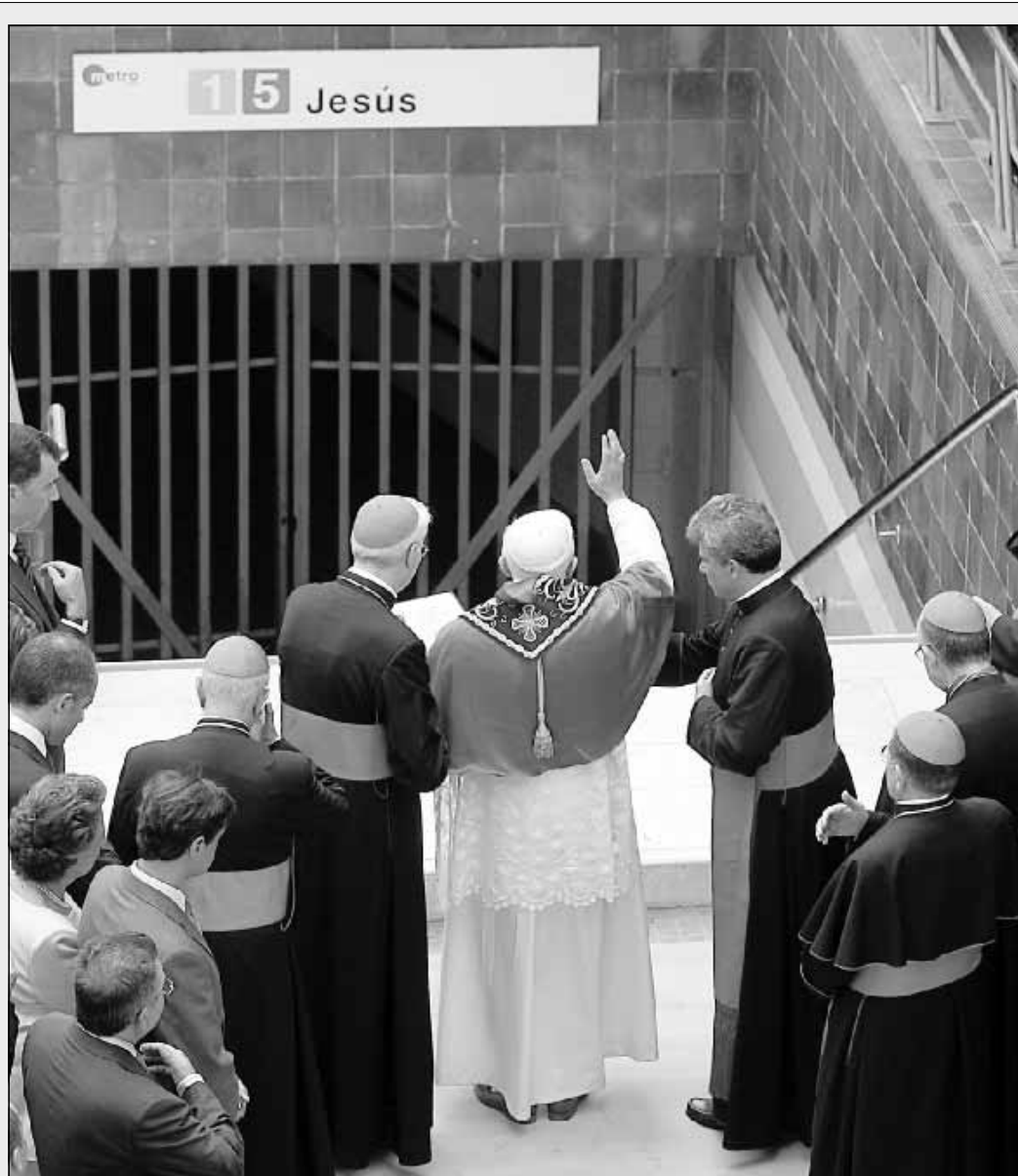
Il Santo Padre benedice l'ingresso della stazione «Jesus» della metropolitana di Valencia, dove lunedì scorso è avvenuto il tragico incidente che ha provocato 42 vittime e numerosi feriti

Nel pomeriggio di sabato, dopo la visita di cortesia ai Reali di Spagna e l'incontro con il Presidente del Governo, il Papa presiede l'incontro di festa e di testimonianza presso il moderno complesso della Città delle Arti e delle Scienze. Nella mattina di domenica, la Santa Messa conclusiva del V Incontro Mondiale delle Famiglie.